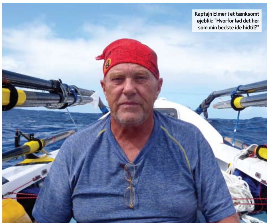
Kaptajn Elmer i et tænksomt øjeblik: "Hvorfor lød det her som min bedste ide hidtil?"