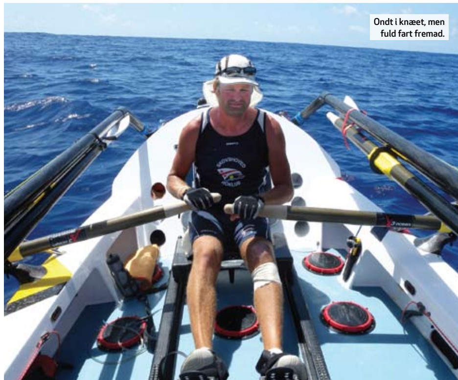
Ondt i knæet, men fuld fart fremad.