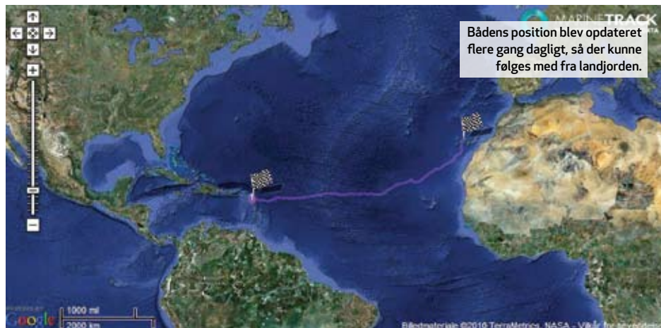
Bådens position blev opdateret flere gang dagligt, så der kunne følges med fra landjorden.